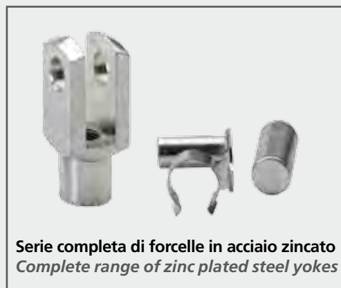
Serie completa di forcelle in acciaio zincato Complete range of zinc plated steel yokes

Forged zinc plated steel housing Bronze outer ring coated with PTFE Rectified, polished and hardened steel inner ring.